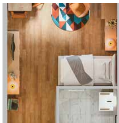
Beispielgrundriss (Apartment 02), 25 m²

Ihr Apartment in der Wohngemeinschaft ist Ihr individuelles kleines Reich. Mit eigenen Möbeln und Erinnerungsstücken gestaltet, wird es schnell zu Ihrem Zuhause. Es bietet Ihnen den Freiraum, Ihre persönlichen Interessen zu verfolgen – ob Lesen, Basteln oder einfach Entspannen. Gleichzeitig sind Sie nie weit entfernt von netter Gesellschaft.